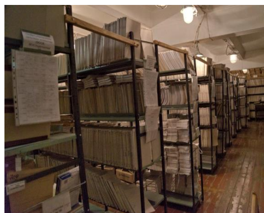
Огромные массивы данных на бумаге! Это часть нашей истории.

Сегодня Новосибирскстат – это более 350 специалистов, которые трудятся для того, чтобы обеспечивать актуальной статистической информацией, как государственные институты, так и обычных граждан. Мы надеемся, что эта экскурсия помогла Вам ближе познакомиться с нашей работой, заглянуть за кулисы и чуть больше заинтересоваться статистикой.