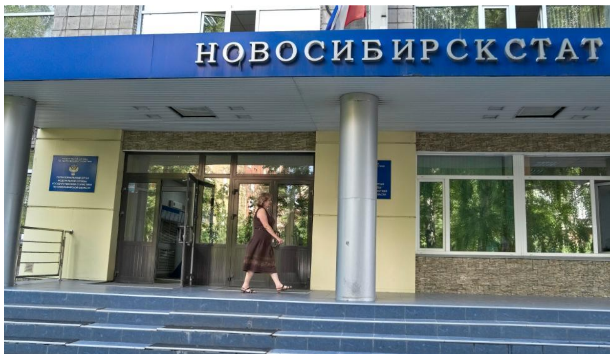
Большая надпись и флаг Российской Федерации — нас сложно не заметить.

Начнём с местоположения и входа в здание. Мы находимся в г. Новосибирске на улице Каинская, 6.