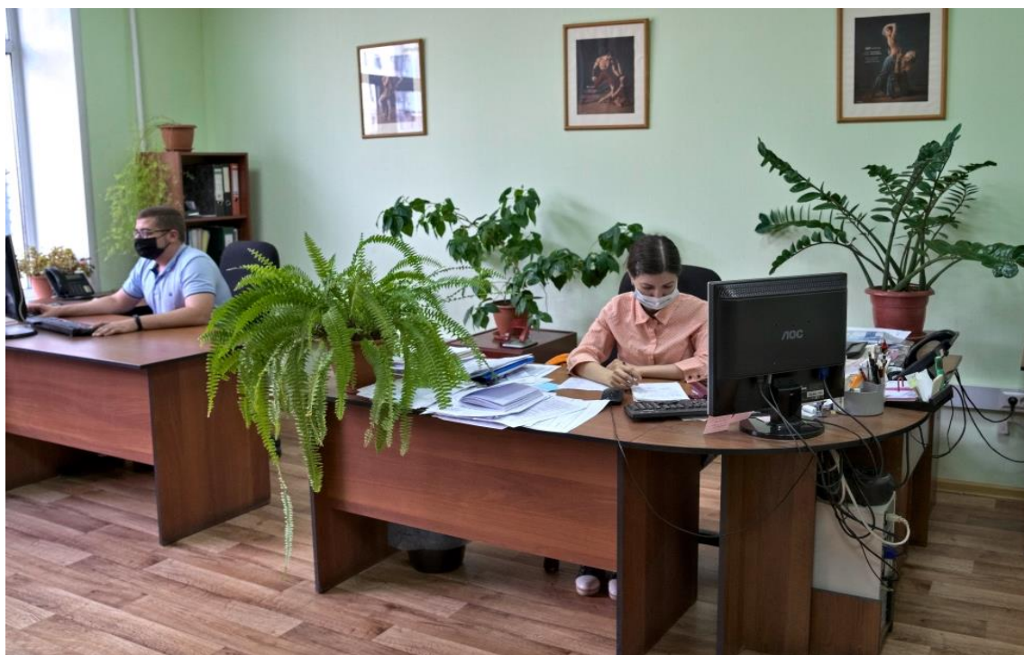
Сплочённый, трудолюбивый коллектив Новосибирскстата.

Сегодня работники Новосибирскстата осуществляют сбор и обработку информации на рабочих местах, оборудованных всеми необходимыми инструментами для качественного и оперативного выполнения своих обязанностей. Мы постоянно обучаемся и внедряем новые технологии для увеличения эффективности разработки и точности получаемой информации.