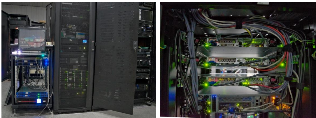
Вся магия происходит внутри этих шкафов.

Всего здесь установлено 9 шкафов высотой больше человеческого роста, которые наполнены всевозможными вычислительными мощностями и коммутационным оборудованием. Два оптоволоконных кабеля обеспечивают бесперебойную связь с системой Федеральной службы статистики, ведь информационно-вычислительная сеть Новосибирскстата – это всего лишь небольшая часть мощнейшей ИВС Росстата.