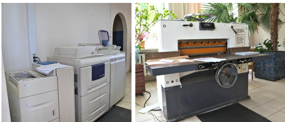
Печатное оборудование и станок для резки бумаги.

Собственная небольшая типография оборудована всем необходимым, чтобы готовить печатные издания Новосибирскстата.